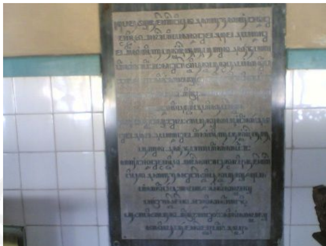
Gambar 1 Prasasti Dinding Masjid

Di kompleks Masjid Agung Surakarta terdapat prasasti di dinding di antara pintu ketiga dan keempat dari selatan ditulis dalam huruf dan bahasa Jawa. Prasasti ini dipahatkan pada panil batu, dengan bunyi sebagai berikut :