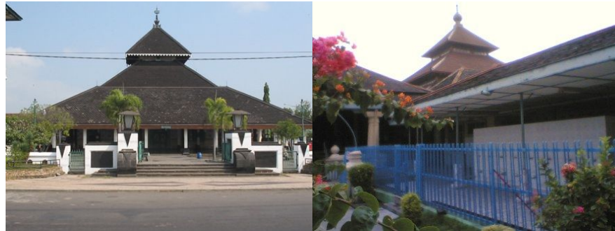
Gambar 2. Masjid Demak dan Masjid Agung Surakarta

Bangunan utama Masjid Agung Surakarta berupa ruang shalat yang berdenah bujur sangkar. Atap ruang utama ditopang oleh 4 (empat) soko guru