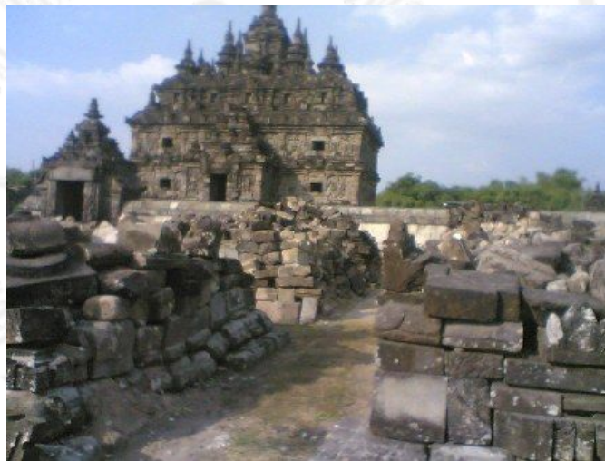
Gambar 3. Candi Plaosan Lor

Konsep tersebut di atas dapat dikembangkan lagi pemaknaannya pada tataran keempat dengan acuan bangunan gunung yang didesain maupun dikonstruksi bangunan dengan pola semakin ke atas bentuk bangunannya semakin mengecil ( mengerucut ). Hubungan antara tanda dan acuan yang berdasar konvensi berupa simbol . Interpretasi dari acuan tersebut adalah konsep bangunan gunung.