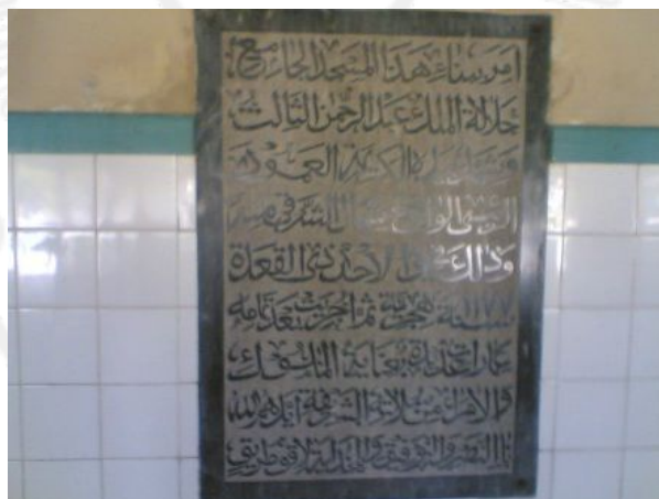
Gambar 2 Prasasti Masjid Agung Surakarta

Prasasti ini berhuruf dan berbahasa Arab yang ditempelkan di dinding. Bunyi prasasti tersebut adalah :