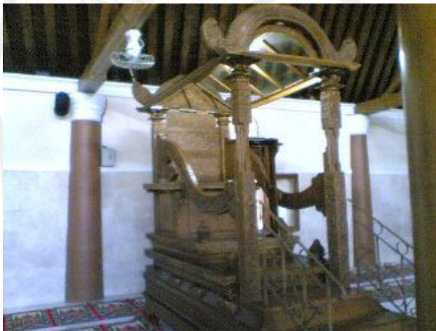
Gambar 7.. Mimbar Masjid Agung Surakarta

Dalam ensiklopedi Islam 3 ( 2001 : 175 ) mimbar semula berarti tempat duduk yang agak ditinggikan dan diperuntukkan bagi Nabi Muhammad Saw, di Masjid Madinah jika Nabi Muhammad Saw berkhotbah menghadap kaum muslimin yang duduk bershaf-shaf. Kemudian atas usul Tamim ad-Dari, salah seorang sahabat dan periwayat hadits, yang melihat orang memakai mimbar di Damaskus, untuk Nabi Muhammad Saw dibuatkan mimbar . Mimbar itu dibuat dua buah anak tangga oleh seorang tukang bernama Kilab, hamba sahaya Abbas bin Abdul Mutholib