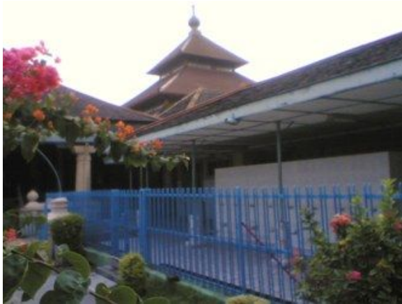
Gambar 1. Masjid Agung Surakarta tampak dari utara

beserta gapuranya, pendapa pagongan, bangunan bekas istal beserta tempat kereta raja, perumahan Gedang Selirang, dan bangunan bekas madrasah Maba'ul Ulum.