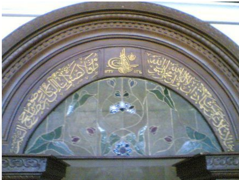
Gambar 6. Mihrab Masjid Agung Surakarta bagian atas

ruang utama Masjid Agung Surakarta berwarna kuning, hijau tua, dan hijau muda. Kapitel pilaster dihias dengan motif geometris dan patra, demikian pula bagian bidang lengkungnya. Terdapat juga ornamen berbentuk bulat sabit tertelungkup yang berisi kaligrafi Arab dan hiasan kaca timah yang bermotif tumbuh-tumbuhan.