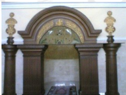
Gambar 4. Mihrab Masjid Agung Surakarta

Dalam sejarah perkembangan masjid, mihrab merupakan bagian pokok, terpenting, atau yang selalu harus ada dalam komponen bangunan masjid, meskipun tidak selalu beratap lengkung. Bahkan pada bangunan tempat beribadah untuk umat Islam yang lebih kecil seperti surau atau mushala, mihrab ini selalu ada. Lebih dari itu banyak masjid yang menggunakan tiga mihrab, yakni sebelah kanan untuk mimbar khatbah, tengah sebagai tempat imam memimpin shalat berjamaah, dan sebelah kiri digunakan untuk tempat menyimpan Al-Qur'an ( Ensiklopedi Islam 3, 2001 : 232 ).