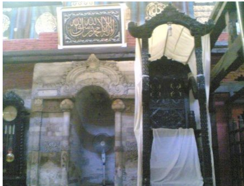
Gambar 9. Mihrab dan Mimbar Masjid Agung Cirebon

Di Masjid Agung Surakarta, mimbar terbuat dari kayu, denahnya berbentuk persegi panjang. Ukurannya 375 cm x 138 cm, tinggi 327 cm. Terdiri atas tiga bagian pokok, yaitu bagian dasar, dudukan dan sandaran, dan bagian atas. Bagian dasar mimbar terdiri atas lima anak tangga, sepasang tiang penyangga bagian atas, dan lantai mimbar. Pada bagian ini terdapat ornamen bunga teratai (padma). Bagian atas terdiri atas lengkungan di atas tiang penyangga dan lengkungan di atas sandaran mimbar. Kedua lengkungan tersebut dipenuhi dengan ornamen dan saling dihubungkan oleh tiga bilah kayu. Pada ketiga bilah kayu ini diletakkan kaca berbingkai yang membentuk atap. Mimbar dicat warna kuning emas, kuning, dan hijau. Pada sisi belakang bagian dasar mimbar terdapat dua prasasti angka tahun '1940' yang masing-masing ditulis dalam angka Jawa dan angka Latin. Pada bagian sandaran mimbar terdapat temuan yang menarik, yaitu pada ornamennya yang terdiri atas tiga panil yang disusun secara vertikal. Setiap