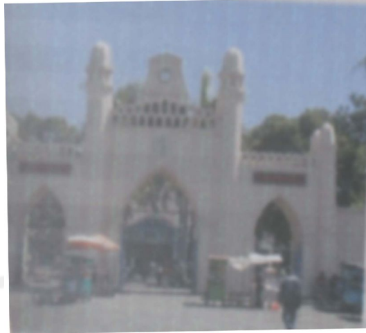
Gambar Gapura Masjid Agung Surakarta

Bangunan Masjid Agung Surakarta dibatasi atau dikelilingi oleh pagar pembatas. Tepat di tengah-tengah pagar bagian timur terdapat pintu masuk. Pintu masuk ini lebih dikenal dengan istilah gapura. Gapura ini dibangun pada masa pemerintahan Sri Susuhunan Paku Buwana X tepatnya pada tahun 1908 M. Gapura ini dibangun dengan meniru arsitektur gaya Persia. Gapura di Masjid Agung ini memiliki pintu berjumlah tiga. Pintu bagian tengah adalah pintu utama. Pintu gapura ini memiliki ukuran yang lebih lebar dan besar daripada pintu gapura di sebelah kanan dan kirinya. Pintu gapura di bagian tengah ini merupakan pintu gapura yang selalu dibuka setiap pukul 04.00 – pukul 20.00 Wib. Sedangkan kedua pintu gapura di sebelah kanan dan kirinya hanya dibuka pada saat upacara ritual seperti Gunungan Gerebeg Sekaten , Gunungan Idul Adha, dan Gunungan Idul Fitri berlangsung.