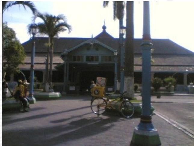
Gambar 1. Masjid Agung Surakarta Tampak Depan

Sementara itu, di beberapa daerah termasuk di Surakarta ini, fungsi masjid menjadi sangat penting, sehingga tidak mengherankan jika keberadaan antara bangunan karaton ( istana ), masjid, alun-alun dan bangunan penunjang lain menjadi satu kesatuan yang tidak terpisahkan.