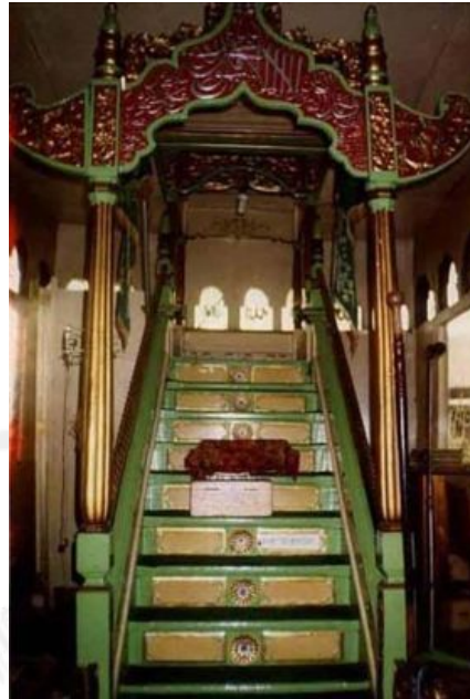
Gambar 8. Mimbar Masjid Sultan Suriansyah Banjarmasin

Bentuk mimbar di Indonesia ada yang menyerupai singgasana dengan sandaran tangan. Misalnya, mimbar masjid Agung Cirebon dan Demak. Mimbar Masjid Agung Cirebon terbuat dari kayu jati dengan ukiran padat, bagian mahkotanya membentuk hiasan seperti kala makara ( raksasa ) yang disamarkan agar tidak realistik. Pada Masjid Agung Banten, mimbarnya diberi hiasan ukiran yang diperkaya dengan warna cat merah dan kuning emas, dan bagian puncaknya yang berbentuk lengkung dihiasi dengan motif tulisan kaligrafi.