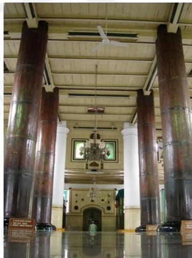
Gambar 5. Mihrab Masjid Agung Demak

Mihrab pada umumnya terletak di ujung barat tengah bangunan masjid, berseberangan dengan pintu masuk. Di sebelah kanannya terdapat mimbar. Di atasnya sering terdapat kaligrafi dengan berbagai macam model, di antaranya tulisan ayat-ayat Al-Qur'an, kalimah syahadat, kalimat thayyibah maupun ayat-ayat yang berkaitan dengan shalat.