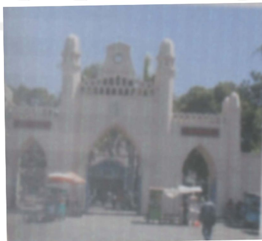
Gambar Gapura Masjid Agung Surakarta