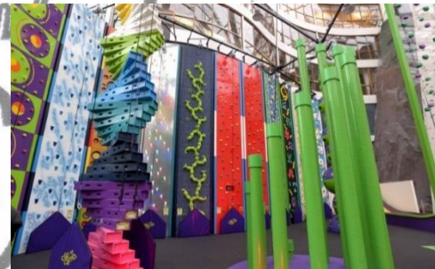
Gambar 3.20. Fun Wall