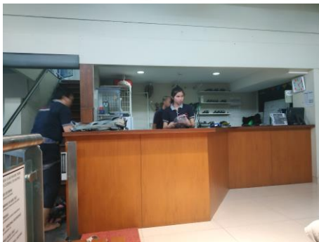
Gambar 3.11. Lobby Receptionist