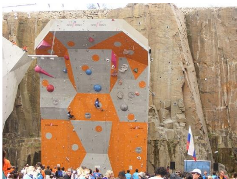
Gambar 3.15. Lead Wall

Fungsi rekreasi menjadi fungsi yang paling utama dari EICA. Area panjat indoor didominasi oleh papan panjat rekreatif yang menjadi satu area dengan papan panjat prestasi. Area panjat utama tersebut dapat menampung hingga 1.800 orang dan 300 pemanjat dengan suasana ruang seakan-akan seperti di dalam tambang. Papan panjat boulder terletak di tengah – tengah ruangan, sedangkan untuk papan panjat lead berada di sekeliling ruangan dengan ketinggian yang bervariasi. Untuk mendukung fungsi rekreasi, disediakan fasilitas penunjang rekreasi berupa kafetaria dan gym. Untuk menikmati fasilitas wall climbing rekreasi ini dikenakan biaya sebesar £10.80 atau setara hampir Rp. 205.000,00