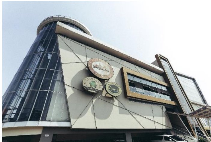
Gambar 3.5. Bremgra Indoor Climbing Gym