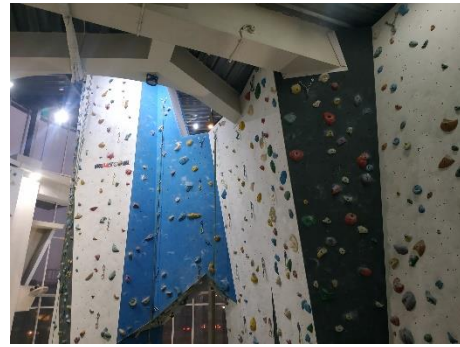
Gambar 3.8. Lead Wall Area