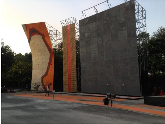
Gambar 3.2. Dinding Lead dan Speed