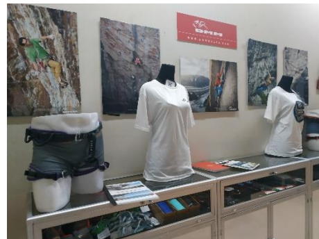
Gambar 3.12. Mini Equipment Shop