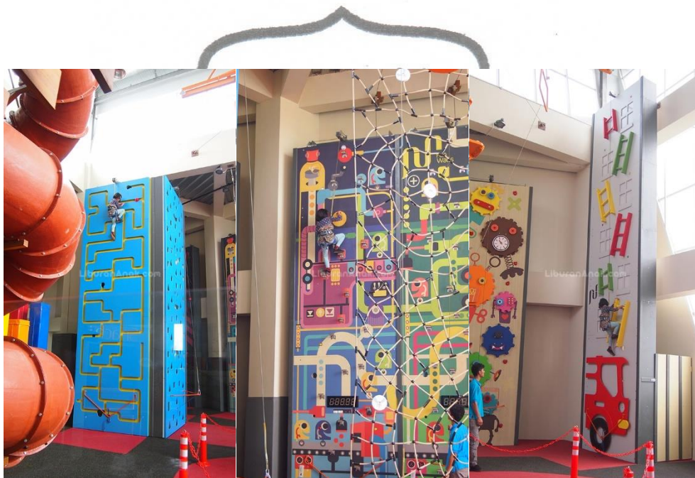
Gambar 3.6. Fun Wall Area