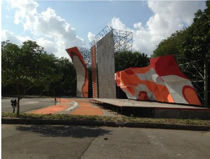
Gambar 3.1. FPTI Surakarta