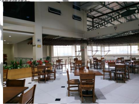
Gambar 3.10. Cafe Area