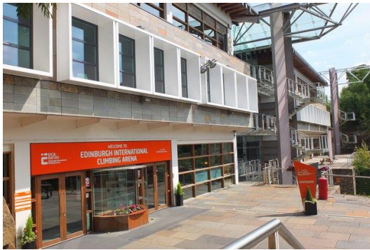
Gambar 3.13. Edinburgh International Climbing Arena