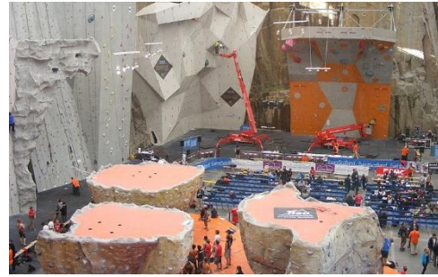
Gambar 3.18. Area Panjat Eagle View