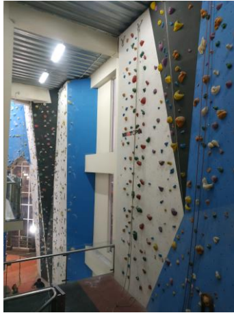
Gambar 3.7. Lead Wall Area