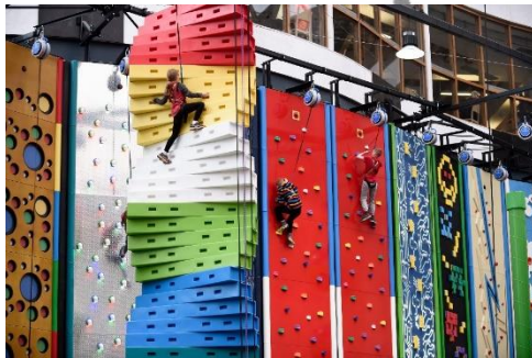
Gambar 3.19. Fun Wall