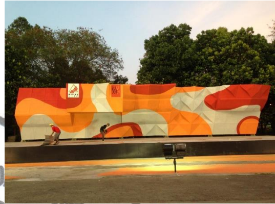
Gambar 3.3. Dinding Boulder