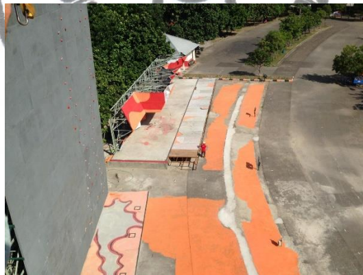
Gambar 3.4. Area Penonton