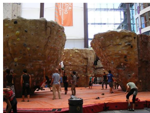
Gambar 3.16. Boulder Wall