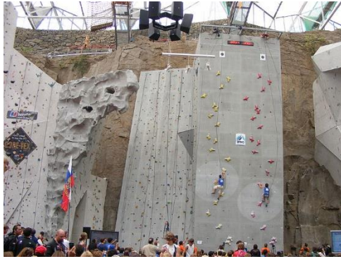
Gambar 3.17. Speed Wall