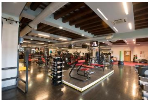
Gambar 3.21. Gym Area