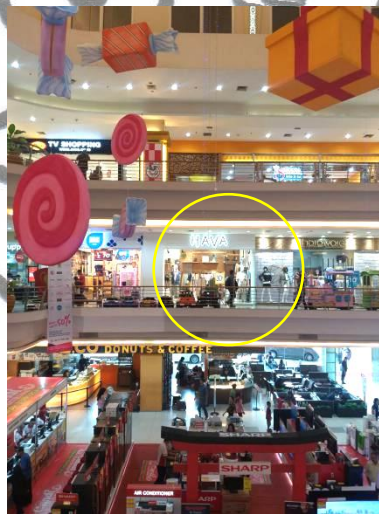
Gambar 3.4 . Retail Hava lantai 2 SoloSquare