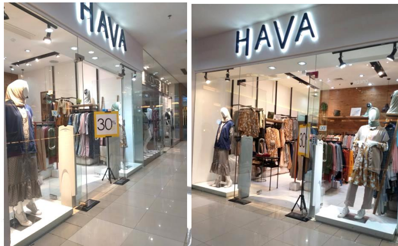
Gambar 3.3 . Retail Hava Solo (Sumber : Dokumentasi pribadi)