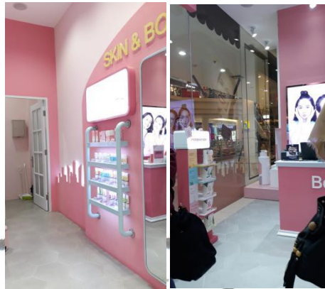
Gambar 3.6. Display penjualan make up dan body care Emina