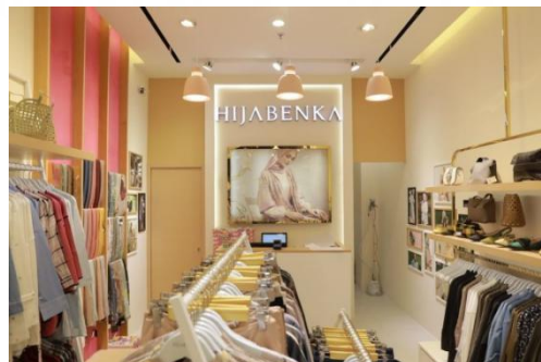
Gambar 3.1. Tampak perspektif 1 Hijabenka Kota Kasablanka

Hijabenka adalah nama Brand sekaligus nama toko hijab dan fashion busana muslim yang didirikan oleh Berrybenka Jason. Berbekal ide brilian dan modal yang cukup, Berrybenka Jason mendirikan startup Berrybenka, situs belanja online yang fokus menjual pakaian pria dan wanita di tahun 2012. Seiring berjalannya waktu, lahir pula Hijabenka yang menjajakan busana muslim modern secara online. Semua dirintis Jason dari nol. Berjuang dari sebuah garasi rumah, jatuh bangun menghadapi masa-masa sulit, hingga akhirnya berjaya.