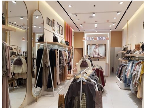
Gambar 3.2. Tampak perspektif 2 Hijabenka Kota Kasablanka

Fasilitas ruang serta area yang tersedia berupa area pamer aneka koleksi hijab dan busana muslim, 1 kamar pas, kasir ,ruang manager dan gudang. Aktifitas yang terdapat pada toko hijabenka antara lain: