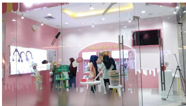
Gambar 3.5 . suasana didalam toko emina