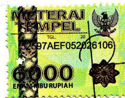
Charisma Nurwiyono Putri